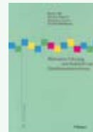
Band 5: Hilb/Höppner/Leenen/Mühlebach: «Wirksame Führung und Aufsicht von Familienunternehmen»