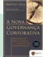
1. Auflage Sao Paolo 2009