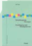
Band 2: Dubs: «Verwaltungsrats-Sitzungen»