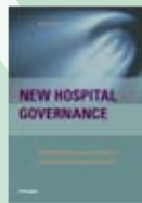
Hilb: «New Hospital Governance»