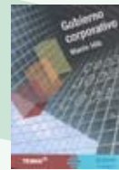
1. Auflage Buenos Aires 2007