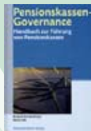
Brandenberger/ Hilb (Hrsg.): «Pensionskassen-Governance»