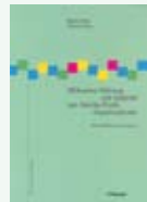
Band 6: Hilb/Renz: «Wirksame Führung und Aufsicht Not-for-Profit Organisationen»