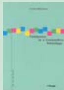
Band 1: Mühlebach: «Familyness as Competitive Advantage»