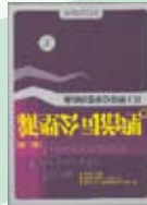
1. Auflage Peking 2008